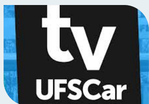
IMAGEM DISPONÍVEL AQUI

A TV UFSCar é uma iniciativa conjunta da UFSCar e da Fundação de Apoio Institucional ao Desenvolvimento Científico e Tecnológico (FAI•UFSCar). Seu objetivo é ampliar a visibilidade das ações e iniciativas destas instituições divulgando conteúdo audiovisual em canais públicos, privados e emissoras de televisão legalmente constituídas.